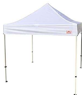
ワンタッチ式 白テント