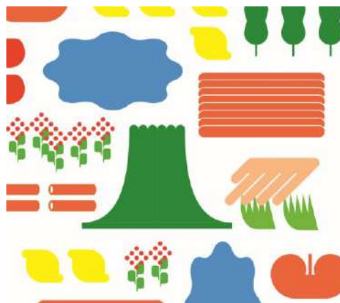
(ビジュアルイメージ)